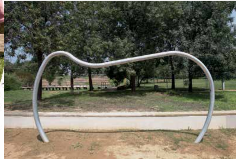
▶ Porteria situada a la zona esportiva del parc.

Aquest mes de juliol finalitzen les obres de remodelació del parc del Llobregat. Els treballs de millora han permès canviar notablement l'aspecte d'aquesta gran zona verda del barri de Falguera i millorar-ne el funcionament. El projecte de reforma ha incorporat diverses de les propostes del Consell d'Infants (la vila de barrufets, el pont tirolès, una àrea esportiva amb porteries, cistelles de bàsquet i tennis de taula, zones de gimnàstica i de pícnic, una oficina d'objectes perduts i una botiga de laminadures). A més de les peticions dels infants, el parc també disposa d'un escenari amb grades per fer-hi representacions i amb capacitat per a 50 persones, un espai d'expressió musical amb instruments que es poden tocar lliurement, així com un espai d'expressió artística amb un mur de pissarra natural per dibuixar. La reforma inclou també la reparació dels camins del parc i l'arranjament de les infraestructures perquè més endavant hi hagi accés gratuït a la xarxa Wi-Fi i alhora es pugui gestionar de forma intel·ligent l'enllumenat i el reg.