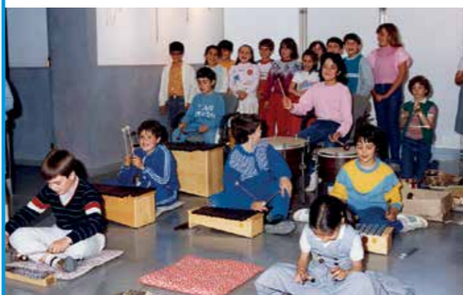
► Alumnes de l'Escola de Música, el maig de 1987, a les instal·lacions de Can Ricart.