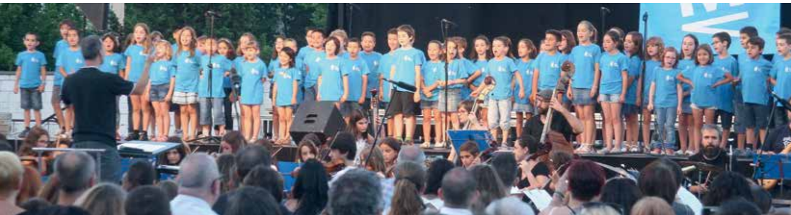
► El 20 de juny va tenir lloc el concert de cloenda del 30è aniversari a la plaça de Lluís Companys.

Han passat 30 anys des que l'Escola Municipal de Música va obrir les portes a Sant Feliu. Al llarg d'aquest temps el centre s'ha consolidat i ha incrementat tant el nombre d'alumnes com el ventall de cursos per formar-se en l'àmbit musical. La celebració de l'aniversari s'ha pogut viure al llarg de tot el curs escolar, sobretot a través d'activitats i trobades musicals com una Marató de Combos o la VII Trobada de Flautes Travesseres de Catalunya. Sens dubte, però, el plat fort va ser el concert del 20 de juny a la plaça de Lluís Companys, on es van reunir alumnes i exalumnes de l'Escola de Música per tocar i cantar plegats.