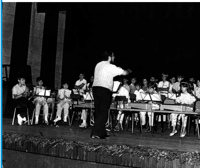
► El 22 de juny de 1985 l'escola va celebrar el primer concert de final de curs al Centre Parroquial.

Han passat 30 anys des que l'Escola Municipal de Música va obrir les portes a Sant Feliu. Era el curs 1984-1985 i els prop de 140 alumnes de l'etapa inaugural del centre assajaven a Can Ricart. Anys després, el 2003, el centre es va traslladar al Palau Falguera, on es troba actualment.