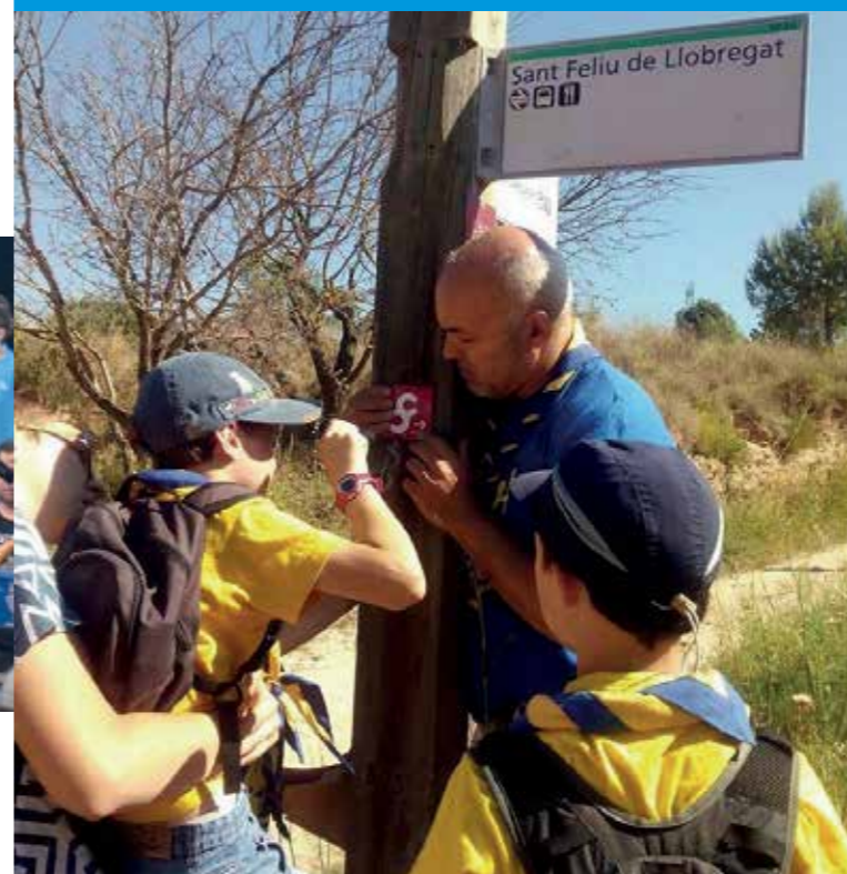
► El Camí té un recorregut a Sant Feliu de 4,9 quilòmetres.

En els darrers tres anys s'han incorporat importants millores que han permès doblar el nombre d'alumnes (440 entre infants i adults), ampliar l'ensenyament musical a infants a partir dels 3 anys i fer participar l'Escola en els esdeveniments culturals de Sant Feliu. A més, en el curs 2014-2015, l'Ajuntament ha aplicat la tarificació social a diferents serveis de l'escola municipal de música per permetre l'accés de la ciutadania a aquest servei en igualtat d'oportunitats i de forma més equitativa i justa socialment. Per aquest motiu els imports mensuals de l'oferta educativa bàsica es determinen segons el nivell d'ingressos i el nombre de persones del nucli familiar.