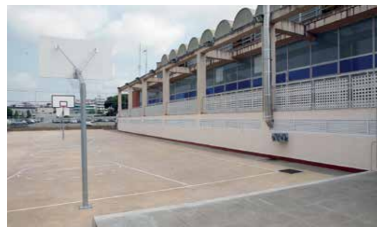
▶ Les dues pistes de minibàsquet s'adrecen especialment als esportistes d'entre 6 i 12 anys.

Les noves pistes exteriors permetran centralitzar els entrenaments al Palau, ja que els equips que entrenaven en escoles es traslladaran a les noves pistes de minibàsquet. A més, les pistes s'utilitzaran per a competicions de Jocs Escolars i, en definitiva, permetran alliberar el Palau Juan Carlos Navarro, molt saturat actualment.