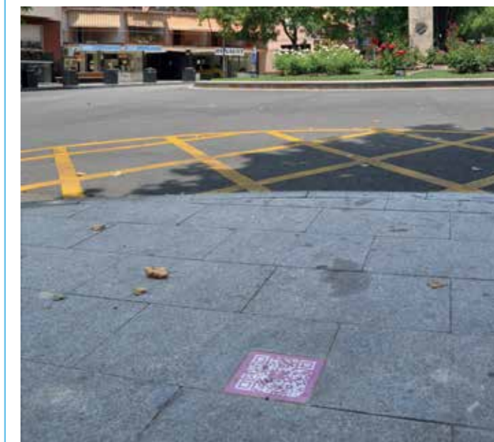
► Les rajoles amb els codis QR ja s'han instal·lat en diversos espais com la plaça Pere Dot.

Les escoles també han pogut participar en un projecte per conèixer la programació amb SNAPI amb l'accés a dades reals, una iniciativa impulsada des del Citilab de Cornellà.