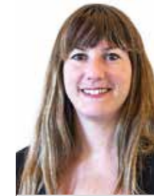
Lúdia Muñoz Cáceres Alcalde

La Comissió de Seguiment és un dels dos instruments amb què s'ha dotat el Pacte de Ciutat per avaluar de manera continua i periòdica el grau d'assoliment dels seus objectius. La ciutadania també pot participar en aquest seguiment de forma activa a través de l'aplicatiu de comptes Midenet, que es pot consultar al portal de transparència del web municipal (www.santfeliu.cat/transparencia) , i on consten tots els indicadors associats a cada actuació i el seu grau d'assoliment.