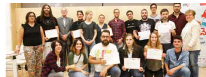
Lliurament de diplomes de l'edició de 2016.

Les activitats es concentraran entre el 20 i el 27 de novembre. Entre les novetats d'aquesta edició s'oferiran tallers a la ciutadania per saber com actuar si es coneix un cas de violència de gènere, així com xerrades, especialment adreçades als més joves, on s'abordarà la violència en les relacions de parella. El programa d'activitats inclourà també la IV Marxa/Manifestació contra la violència masclista del Baix Llobregat, que farà un recorregut per la ciutat finalitzant al parc Torreblanca.