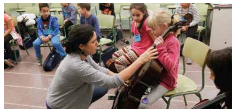
► Els alumnes de tercer de les escoles Falguera i Gaudí tenen l'oportunitat de tocar el violí o el violoncel.

Pel que fa a l'Escola Municipal de Música, la matrícula per a aquest curs és de 443 alumnes. Precisament, enguany l'Escola Municipal de Música ha engegat una experiència nova a les escoles Falguera i Gaudí que permet als alumnes de tercer curs d'aquests centres treballar amb instruments de corda en l'assignatura de música.