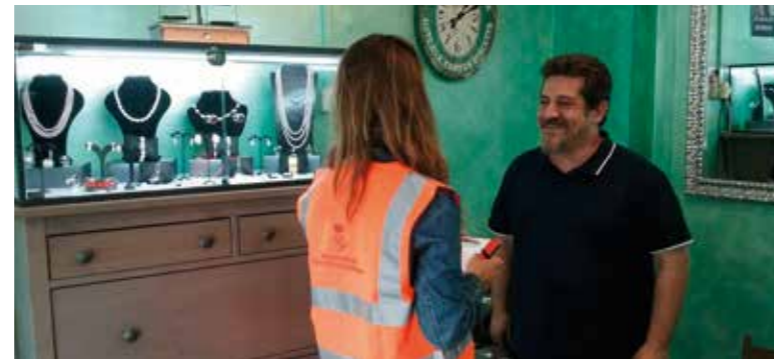
▶ Una informadora ambiental assessora un comerç de la ciutat.

persones, preferentment dels barris de la Salut i Can Calders, a través de quatre plans d'ocupació (9 persones en un pla de promoció de l'autonomia personal com auxiliars de la llar; 2 informadores ambientals i 1 educadora mediambiental, 2 peons i 1 oficial de fibra òptica i 2 dinamitzadors digitals).