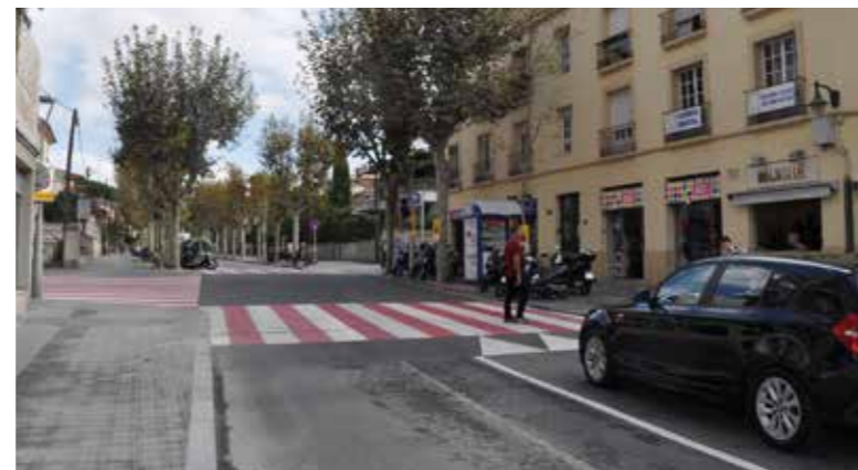
Una de les obres realitzades ha permès millorar l'accessibilitat en la cruïlla del carrer de Dalt amb el passeig de Nadal.

Entre les actuacions hi ha obres de millora d'accessibilitat en cruïlles i passos de vianants, com el del pg. Comte de Vilardaga amb c/ Carles Buigas, c/ Dalt amb pg. Nadal o Torras i Bages amb Vidal i Ribas. També s'han suprimit barreres arquitectòniques al pg. Onze de Setembre o als carrers de Roses i d'Armenteres, i s'han arranjat voreres i paviments en punts com el c/ Mas Lluï o la pl. Villeneuve-le-Roi, entre altres.