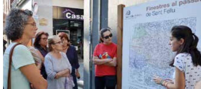
► La ruta guiada per les "Finestres al passat" va ser una de les activitats de la Setmana.

El projecte de reforma del Casal de Joves permetrà disposar d'un espai molt més gran i confortable, al qual s'accedirà des de la plaça del Casal i no des de Laureà Miró, com fins ara. Es mantindrà però un accés pel carrer per entrar directament a la nova sala de concerts, que tindrà capacitat per a 300 persones i estarà totalment insonoritzada.