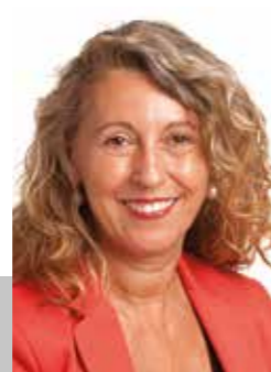
Lourdes Borrell Moreno Presidenta del Grup Municipal del PSC