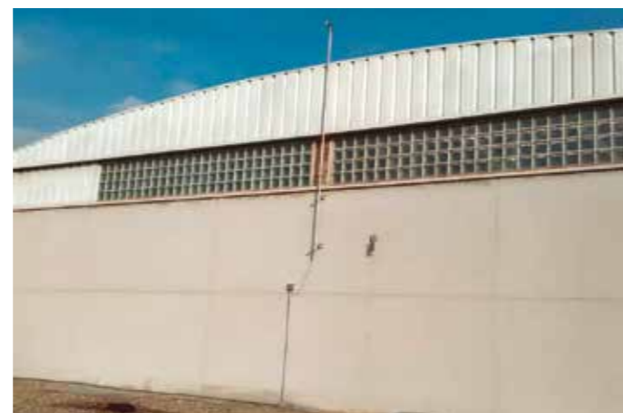
▶ Antena instal·lada al pavelló esportiu de l'escola Falguera que permet enviar les dades de consum que registren els comptadors d'aigua gairebé en temps real.

L'Ajuntament ja està utilitzant el sistema de telemesura, que permet el control telemàtic del consum d'aigua en diferents equipaments municipals. Es tracta d'un sistema innovador de gestió que permet tenir un control detallat dels consums gràcies al seguiment en temps quasi real de l'aigua registrada als comptadors. Aquest sistema permet minimitzar les incidències per fuites, ja que envia avisos en cas de detectar consums elevats. A més, potencia una gestió sostenible d'un recurs escàs com l'aigua, fomentant el consum responsable i sostenible. Per fer viable la telelectura, s'han instal·lat 52 comptadors intel·ligents i 8 antenes receptores a diferents equipaments municipals, que permeten rebre les dades dels comptadors i enviar-les a Aigües de Barcelona.