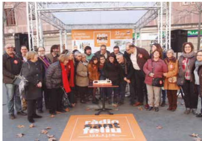
▶ La festa va concloure amb la bufada de les 35 espelmes.

Han passat 35 anys des que Ràdio Sant Feliu va iniciar les emissions al febrer de 1981 i, coincidint amb l'aniversari, l'emissora ha estrenat web i app. A més, la ràdio es va traslladar el 12 de febrer a la plaça de la Vila per fer una programació especial en el dia exacte que es complien 35 anys des de la primera emissió.