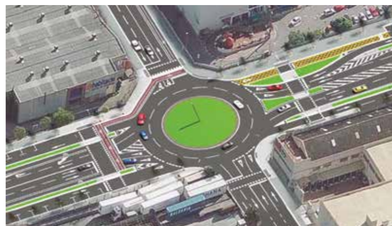
▶ Imatge simulada de com serà la rotonda que s'està construint al davant del futur centre comercial de Laureà Miró.

La nova rotonda permetrà millorar l'accessibilitat dels vehicles a la zona i facilitar el pas dels vianants amb cruïlles amb semàfors. A més, es millorarà el carril bici perquè tingui més seguretat, s'eliminaran les barreres arquitectòniques, es mantindran els carrils laterals de la carretera, es milloraran l'entrada i sortida de l'aparcament del centre comercial, el qual disposarà de senyalització específica a l'exterior amb el