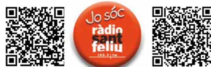
Video 35 anys