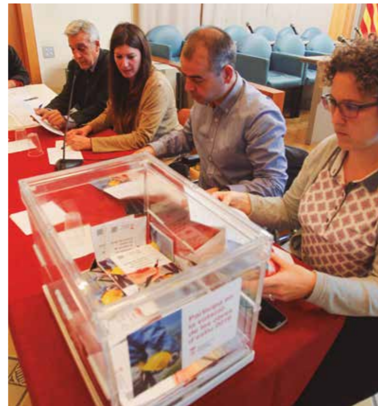
Acte d'escrutini de les votacions.

Els serveis tècnics municipals estan actualment analitzant i pressupostant amb exactitud les actuacions més votades per tal de definir els treballs que es podran executar finalment amb els 400.000 € assignats. Un cop es defineixin, s'aprovaran els projectes i es faran els tràmits habituals per convocar el concurs públic de les obres i adjudicar-les. Tot això serà entre els mesos de febrer i maig.