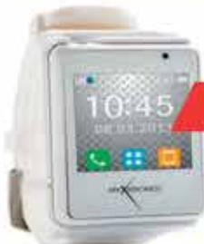
Smartwatch Mykronoz ZeNano