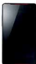
Terminal lliure Hisense U966B Negre 5"