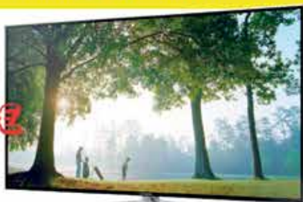
TV Slim Led 3D Samsung 40" UE40H6400