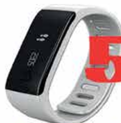
Polsera Fitness Mykronoz ZeFit