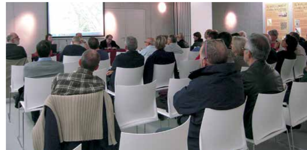
▶ El passat 19 de novembre es va fer un acte al Centre Cívic Mas Lluí per donar a conèixer als veïns i veïnes diverses qüestions d'àmbit urbanístic que afecten al barri.

Amb la retirada de la Modificació del PGM es posa punt i final definitiu al projecte que preveia requalificar més de 15.000 m 2 de zones verdes i equipaments en sòl residencial per construir-hi més de 300 habitatges. L'actuació també preveia la construcció d'un vial per a camions que travessava la zona natural del Torrent del Duc. El conjunt de requalificacions va despertar la ferma oposició de l'AVV Mas Lluí i diverses plataformes ciutadanes.