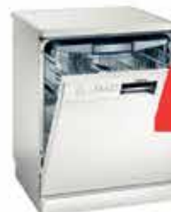
Rentaplats Siemens SN25M290EU