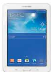
Tablet Samsung Galaxy Tab 3 Blanca Lite