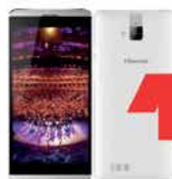
Terminal lliure Hisense HSU980 5.5" HD IPS