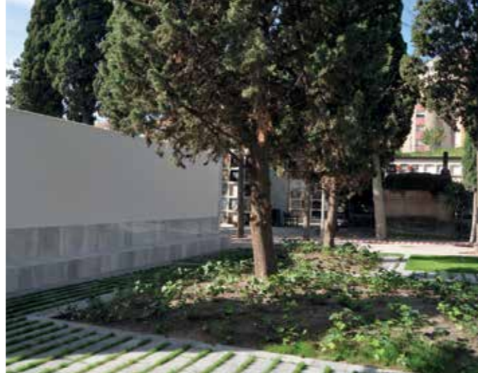
El jardí del repòs conserva els xiprers existents.

Els preus de les concessions de drets funeraris a Sant Feliu estan en línia amb els preus que hi ha a d'altres municipis de l'entorn de característiques similars. Als preus de Sant Feliu se'ls aplica l'IVA perquè el servei està adjudicat a una empresa (impost que s'aplica en funció de qui gestiona el servei), d'acord amb la normativa estatal.