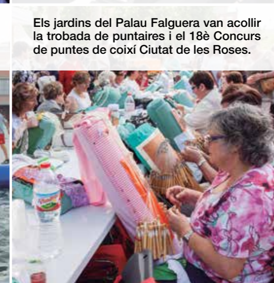
Els jardins del Palau Falguera van acollir la trobada de puntaires i el 18è Concurs de puntes de coixí Ciutat de les Roses.