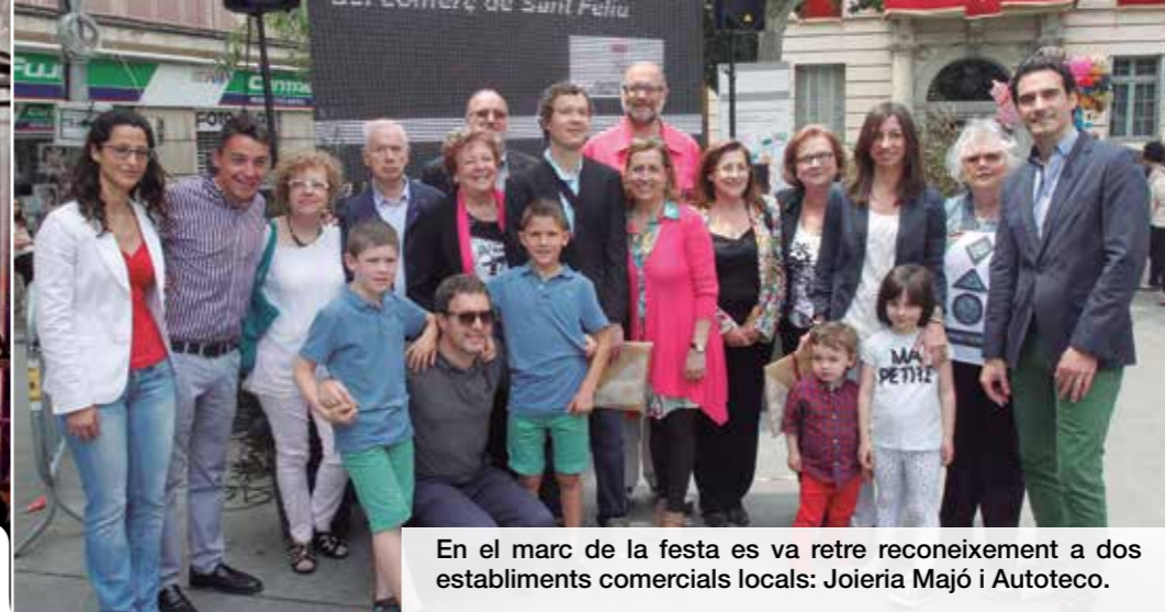
En el marc de la festa es va retre reconeixement a dos establiments comercials locals: Joieria Majó i Autoteco.