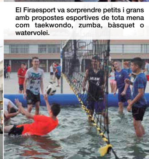
El Firesport va sorprendre petits i grans amb propostes esportives de tota mena com taekwondo, zumba, bàsquet o watervolei.