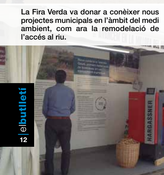
La Fira Verda va donar a conèixer nous projectes municipals en l'àmbit del medi ambient, com ara la remodelació de l'accés al riu.