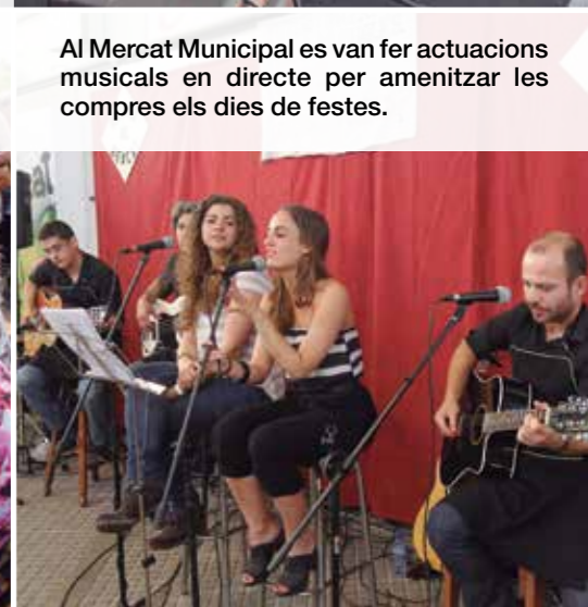
Al Mercat Municipal es van fer actuacions musicals en directe per amenitzar les compres els dies de festes.