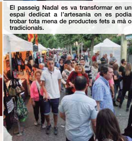
El passeig Nadal es va transformar en un espai dedicat a l'artesanía on es podia trobar tota mena de productes fets a mà o tradicionals.