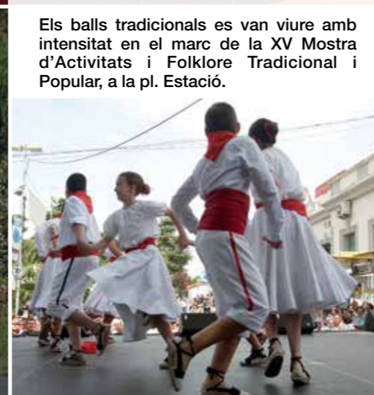
Els balls tradicionals es van viure amb intensitat en el marc de la XV Mostra d'Activitats i Folklore Tradicional i Popular, a la pl. Estació.