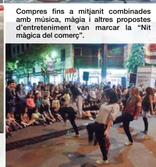
Compres fins a mitjanit combinades amb música, màgia i altres propostes d'entreteniment van marcar la "Nit màgica del comerç".