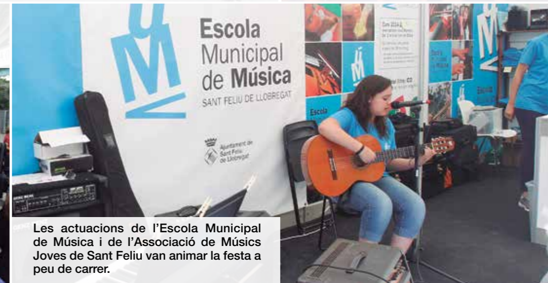
Les actuacions de l'Escola Municipal de Música i de l'Associació de Músics Joves de Sant Feliu van animar la festa a peu de carrer.