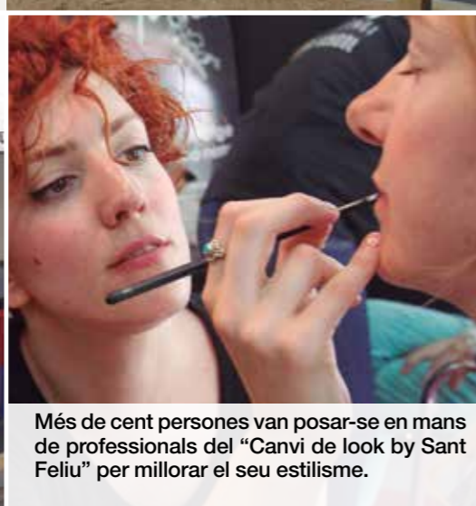
Més de cent persones van posar-se en mans de professionals del "Canvi de look by Sant Feliu" per millorar el seu estilisme.