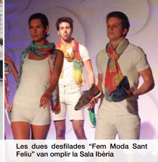
Les dues desfilades "Fem Moda Sant Feliu" van omplir la Sala Ibèria