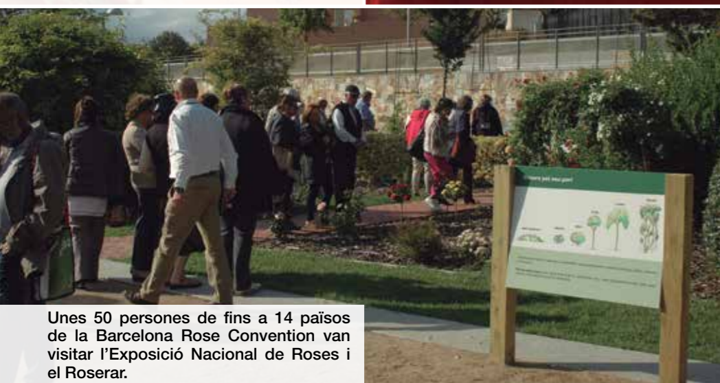
Unes 50 persones de fins a 14 països de la Barcelona Rose Convention van visitar l'Exposició Nacional de Roses i el Roserar.