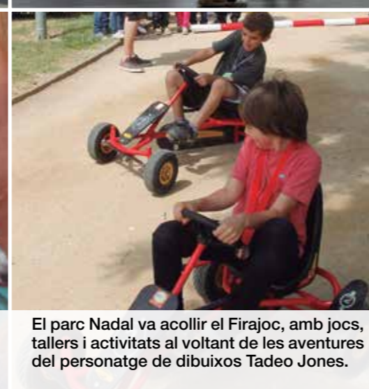
El parc Nadal va acollir el Firajoc, amb jocs, tallers i activitats al voltant de les aventures del personatge de dibuixos Tadeo Jones.