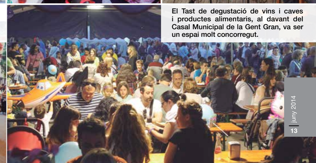
El Tast de degustació de vins i caves i productes alimentaris, al davant del Casal Municipal de la Gent Gran, va ser un espai molt concorregut.