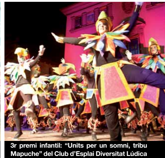
3r premi infantil: "Units per un somni, tribu Mapuche" del Club d'Esplai Diversitat Lúdica