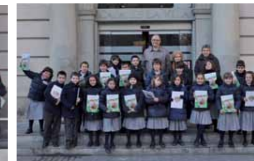
Escola Mare de Déu de la Mercè. 3è primària