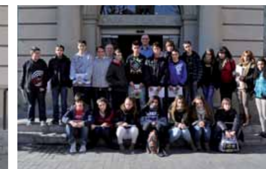
Institut Olorda. 3è ESO