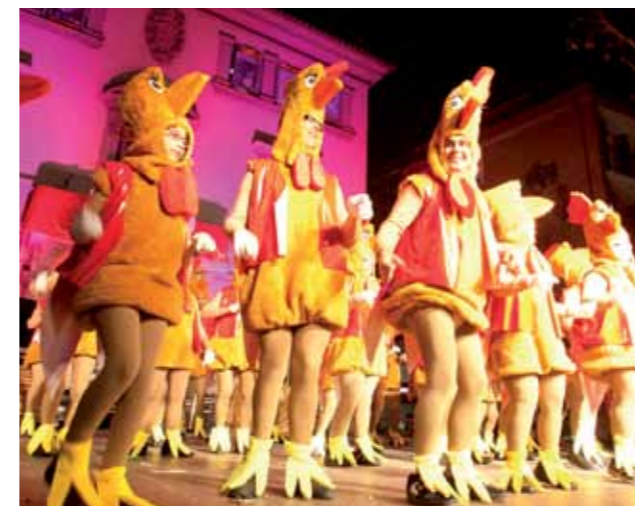
Menció especial: "Aneu amb compte amb aquests galls", d'ASPRODIS

Unes 1.400 persones de 22 comparses van participar el dissabte 18 de febrer en la tradicional rua de Carnaval, que va recórrer els principals carrers de la ciutat. Amb motiu del 30è aniversari de la celebració de la primera rua de Carnaval de la democràcia a Sant Feliu, la Comissió de Carnaval i l'Ajuntament van acordar que el lema i la temàtica de l'edició d'aquest any fos "30 anys d'aventura i fantasia". El jurat del Concurs de Comparses va atorgar 3 premis per a les millors comparses d'adults, 3 premis a les comparses infantils i també va distingir diverses comparses amb mencions especials.