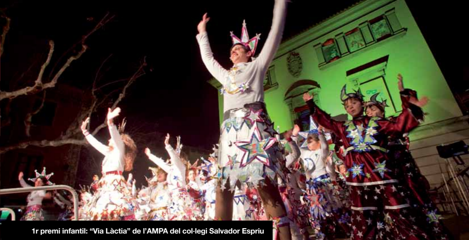
1r premi infantil: "Via Làctia" de l'AMPA del col·legi Salvador Espriu