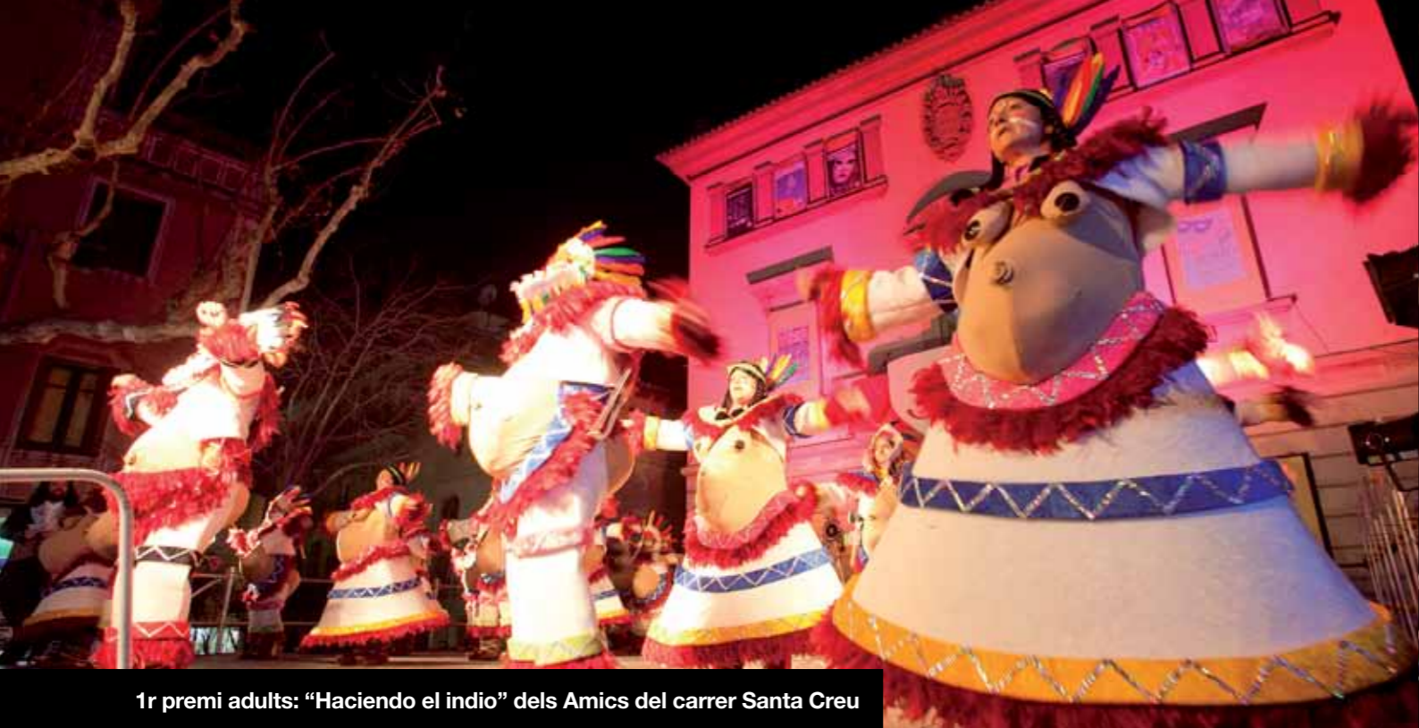
1r premi adults: "Haciendo el indio" dels Amics del carrer Santa Creu