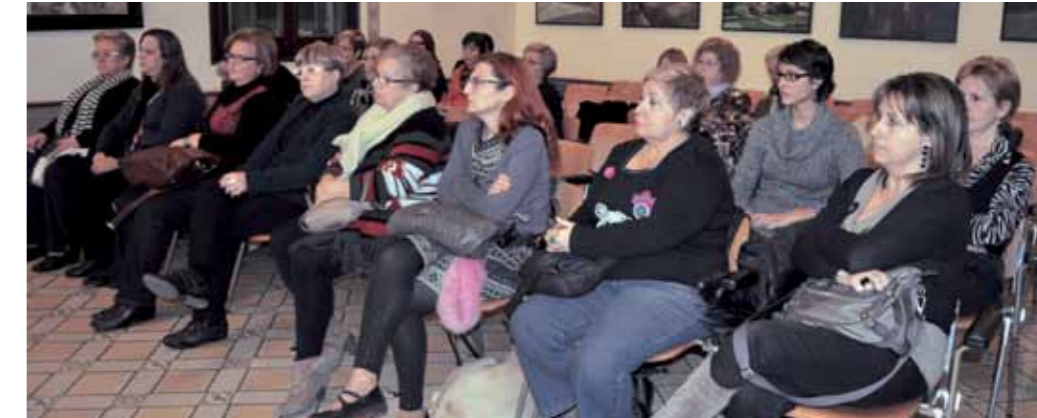
El Consell Municipal de Dones vol reforçar el seu paper com a òrgan d'assessorament del govern local.

Sant Feliu va ser pioner en la creació de serveis com el Servei d'Informació i Orientació a les Dones (SIOD), que funciona des del 1994 o la Xarxa de Coordinació i Atenció a Dones Víctimes de Violència, impulsada el 1999. A més, l'any 1996 va crear el Consell Municipal de les Dones, òrgan de caràcter consultiu que treballa per l'equitat de gènere. Precisament, el 24 de gener va tenir lloc la constitució d'aquest òrgan, que es renova cada