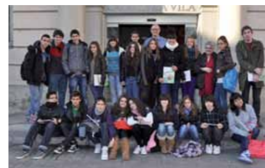
Institut Olorda. 3è ESO