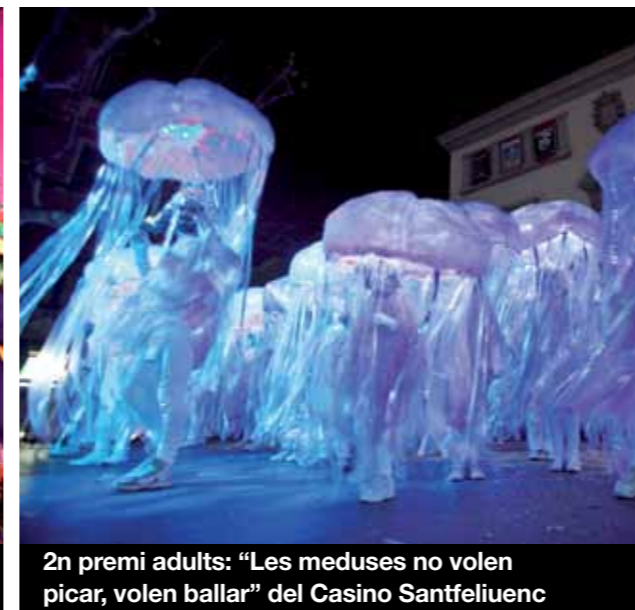
2n premi adults: "Les meduses no volen picar, volen ballar" del Casino Santfeliuenc