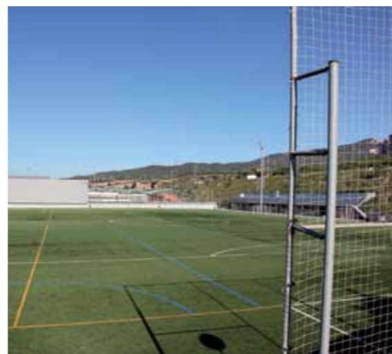
Aquest any s'ampliaran els vestidors i les grades del Parc Esportiu de les Grases.