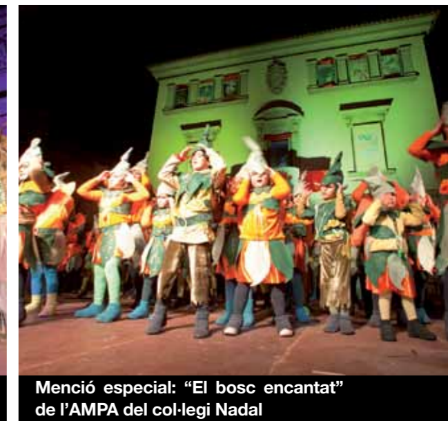
Menció especial: "El bosc encantat" de l'AMPA del col·legi Nadal