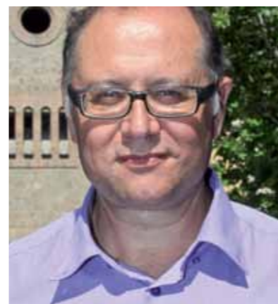
Jordi San José | L'alcalde

Si voleu rebre el Butlletí digit@l de l'Ajuntament cada setmana al vostre correu electrònic, doneu-vos d'alta a www.santfeliu.cat/butlletidigital o bé sol·liciteu l'alta a: comunicacio@santfeliu.cat