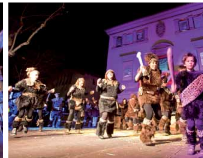
Menció especial: "Sant Feliu 2020, tornant als orígens", d'Els nois de la Rampa