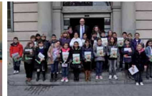
Escola Bon Salvador. 3è primària