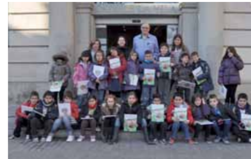
Escola Salvador Espriu. 3è primària

Més de 500 alumnes de primària i secundària de Sant Feliu visitaran al llarg d'aquest curs escolar l'Ajuntament. Les visites, que van començar a mitjan gener, permeten a infants i joves reunir-se amb l'alcalde i conèixer més la ciutat, així com el funcionament, la composició i les tasques del govern municipal.