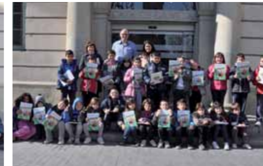
Escola Salvador Espriu. 3è primària