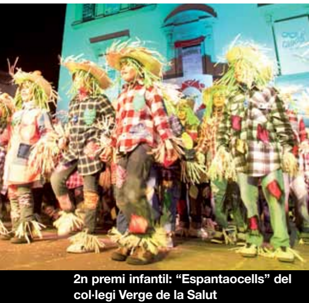
2n premi infantil: "Espantaocells" del col·legi Verge de la Salut