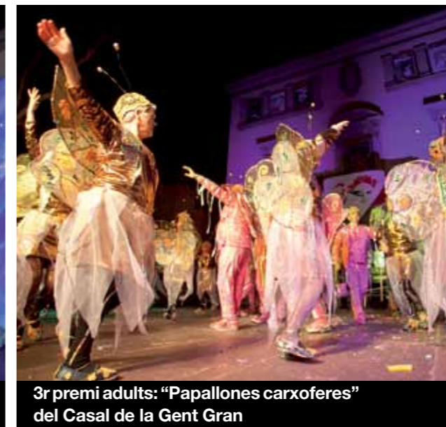
3r premi adults: "Papallones carxoferes" del Casal de la Gent Gran