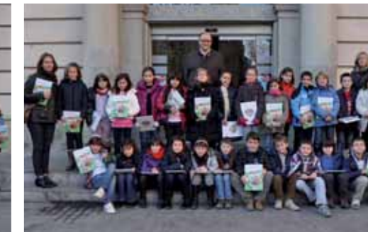
Escola Bon Salvador. 3è primària