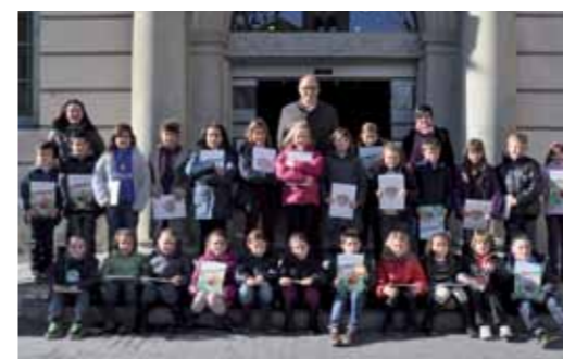
Escola Bon Salvador. 3è primària