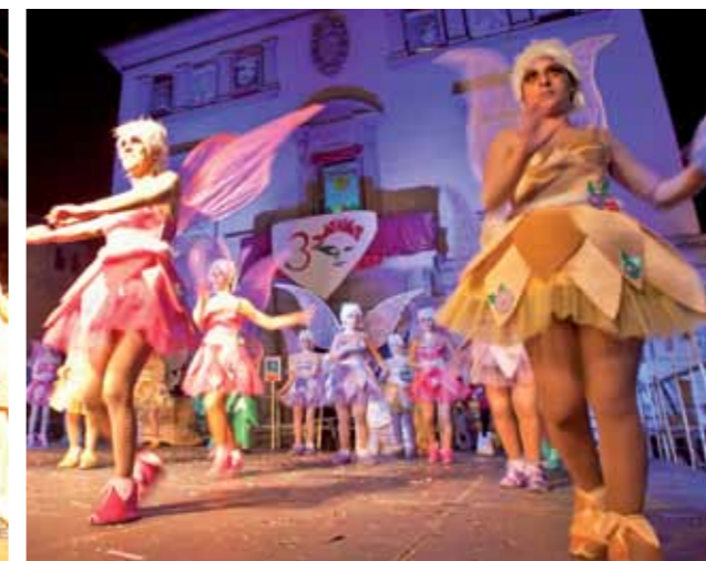
Menció especial: "Fantasiadas", de la Peña Luis de Córdoba