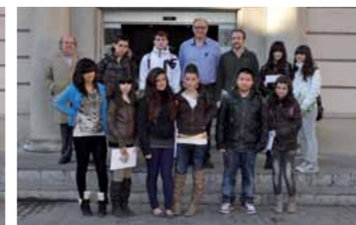
Institut Olorda. 3è ESO