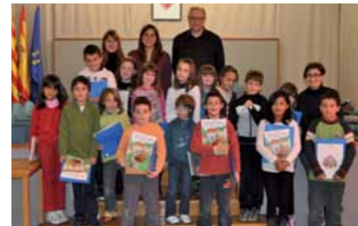
Escola Gaudí. 3è primària