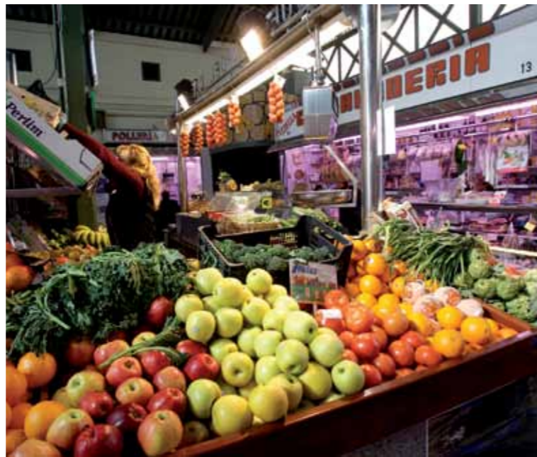
En aquesta legislatura s'invertirà un total de 500.000 € al Mercat Municipal.

El pressupost ordinari de l'Ajuntament de Sant Feliu del 2012, que suma 35,12 milions d'euros, es caracteritza per l'austeritat i la contenció en la gestió de la despesa. Tot i això, garanteix la prestació de tots els serveis, en un any en què l'Ajuntament rebrà menys ingressos de l'Estat i la Generalitat. Precisament per aquest motiu ha estat necessari destinar mig milió d'euros d'inversions procedents de l'Àrea Metropolitana a despesa corrent. D'altra banda, l'Ajuntament assumirà els diners que deixarà d'ingressar de la Generalitat per a les escoles bressol i l'Escola Municipal de Música. Els comptes per al 2012, aprovats amb els vots a favor d'ICV-EUiA-ISF, CiU i PP, i el vot en contra del PSC, preveuen també l'aplicació d'un pla de mesures d'estalvi i prioritzen les partides de serveis socials i d'educació, que augmenten un 8,2 % i un 5%, respectivament.