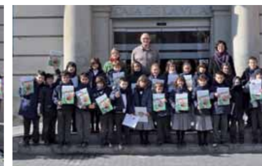
Escola Mare de Déu de la Mercè. 3è primària