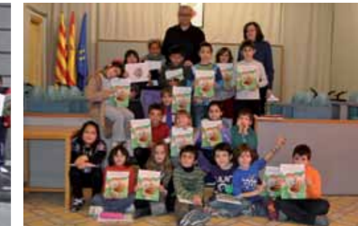
Escola Gaudí. 3è primària