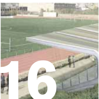
16 ESPORTS. Més de 3 milions d'euros per la zona esportiva de la Salut-les Grases