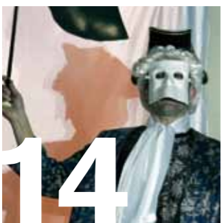
14 CULTURA. Rècord a la tradicional rua de Carnestoltes 2011