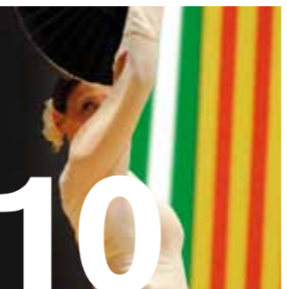
10 CIUTAT. Àmplia participació en la celebració del Dia d'Andalusia