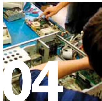
04 OCUPACIÓ. Sant Feliu forma 51 joves aturats en el marc del programa "Suma't"