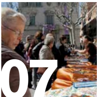
07 DONA. Sant Feliu commemora el Dia Internacional de la Dona amb la inauguració del parc del 8 de març