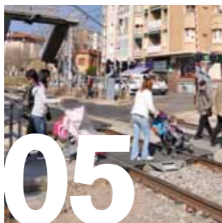
05 SOTERRAMENT. L'Ajuntament continua lluitant per aconseguir el soterrament de les vies del tren