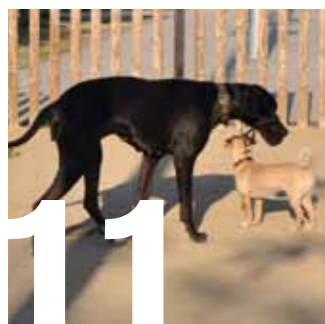
11 CIVISME. Sant Feliu fa del civisme un projecte de ciutat