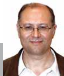
Jordi San José i Buenaventura Portaveu d'ICV-EUiA

Pel que fa al soterrament, aquest ajuntament i aquesta ciutat han fet el que havien de fer. Es tracta d'una qüestió de seguretat i també de justícia. L'objectiu principal és, tot i comprendre la situació econòmica, tancar un compromís amb l'administració de l'estat per determinar la data d'inici d'obres. I és que aquesta ciutat no es pot permetre que tot això quedi en no res, per això no estem disposats a jugar amb l'assumpte amb proclames i promeses electoralistes. El soterrament està més a prop que mai per la seriositat i el treball d'aquest govern encapçalat pel PSC, i només amb el manteniment d'aquestes formes de treballar serà una realitat. Ens hi juguem no un govern sinó els drets i les il·lusions de més de 43.500 ciutadans i ciutadanes que veuen la seva ciutat partida per una via i un pas a nivell.