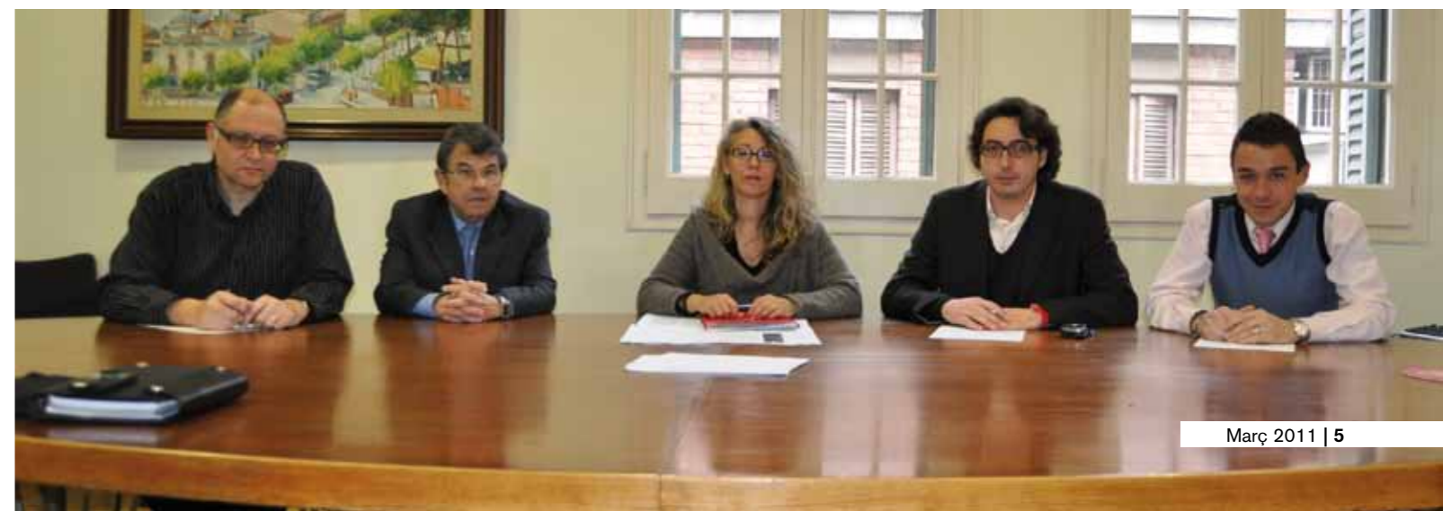
■ Reunió de la Junta de Portaveus municipal

L'alcaldeessa ha demanat a tots els grups polítics amb representació al consistori, seguir mantenint la unitat en aquest projecte cabdal per a Sant Feliu.