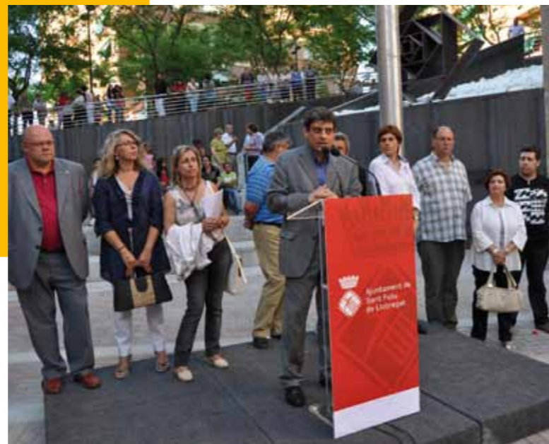
■ L'alcalde va inaugurar els nous espais en un acte a la plaça de les Roses

Can Calders va viure el passat dissabte, 5 de juny, una jornada festiva amb motiu de la inauguració dels nous espais públics del barri que són el resultat de les obres d'urbanització de la zona. Les obres, que es van iniciar l'1 de setembre de 2009, han permès la pavimentació i arranament de les places de les Roses i de la Xocolatada i dels carrers de Can Calders, Can Calders Posterior, Santa Creu Posterior i Agustí Domingo. Es tracta de l'actuació urbanística més important del projecte d'Intervenció Integral als barris de Can Calders i La Salut, que ha suposat una inversió de més de 2 milions d'euros. L'alcalde de Sant Feliu, Juan Antonio Vázquez, va inaugurar oficialment els nous espais de Can Calders en un acte a la plaça de les Roses en el que també hi van ser presents la comissionada del projecte i regidora de l'Ajuntament, Rosa Maria Martí, així com d'altres membres de l'equip de Govern municipal i de l'Associació de veïns del barri de Can Calders.