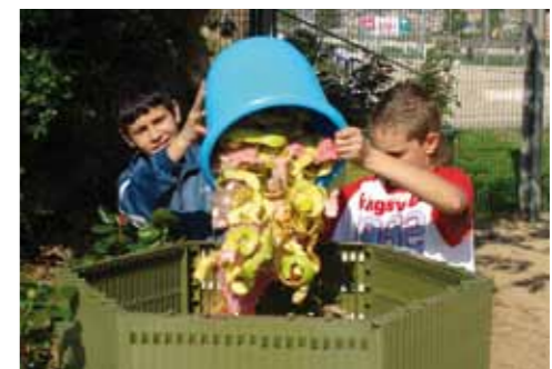
Alumnes de l'escola Salvador Espriu fomenten la recollida selectiva