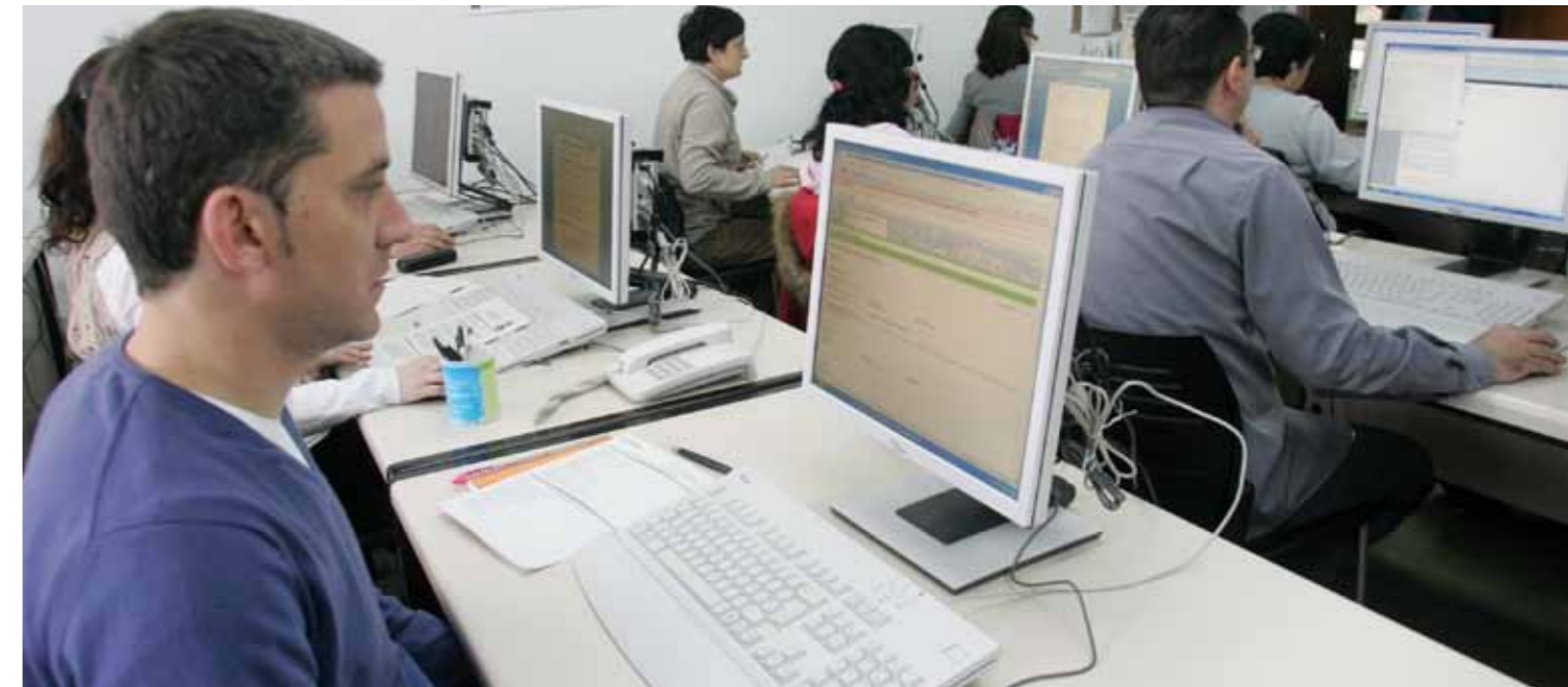
■ El CIFO (Centre d'Innovació i Formació Ocupacional) de Sant Feliu ofereix formació especialitzada per millorar les competències professionals i afavorir la inserció laboral dels alumnes

L'Ajuntament de Sant Feliu ha posat en marxa diferents projectes que permetran la contractació de 126 persones al municipi en els propers mesos. Les contractacions es faran a través d'un pla d'ocupació extraordinari local que donarà feina a 71 persones; a través dels projectes finançats pel Fons Estatal per a l'Ocupació i la Sostenibilitat Local atorgat pel Govern central, que permetran contractar 51 persones; i a través d'un pla d'ocupació forestal que beneficiarà 4 persones. Aquests projectes tenen com a principals objectius millorar l'ocupació de les persones que no troben feina en aquest moment de crisi, augmentar la seva capacitat d'adaptació al canvi i millorar la seva qualificació i les seves competències professionals.