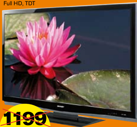
TV LCD SHARP 32" LC32X20E Full HD, TDT