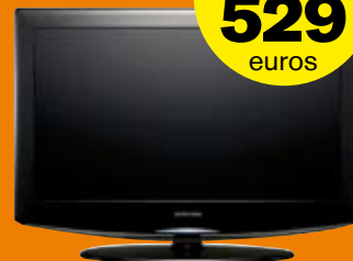
TV LCD SAMSUNG 23" LE23R86B Tamaño de pantalla: 23" Resolución: 1366 x 768 Ratio de Contraste Dinámico: 5000:1 Ángulo de visión: 170/170