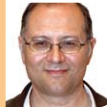
Jordi San José i Buenaventura Portaveu d'ICV- EUiA