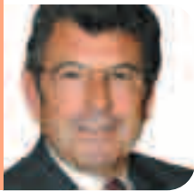
Josep Lluís Fernández Burgui Portaveu del Grup Municipal de CiU