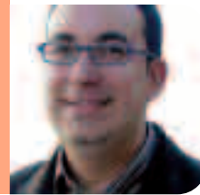
Carles Soriano Portaveu del Grup Municipal d'ERC