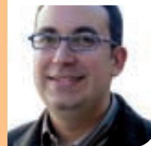
Carles Soriano Portaveu del Grup Municipal d'ERC