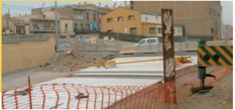
■ Obres de cobertura del primer tram de la riera de Pahissa.

Aquest estiu Sant Feliu de Llobregat no tancarà per vacances. Aprofitant el període estival, el departament municipal d'Urbanisme té previstes més d'una quinzena d'obres a diferents punts de la ciutat. Aquestes actuacions, adreçades a millorar la convivència entre el transit de vehicles i vianants i l'optimització de les infraestructures viàries, tindran quatre blocs d'actuació, com són les accions de pavimentació, enllumenat, pacificació del trànsit i millora de l'accessibilitat i mobilitat. A més, durant l'estiu també continuaran les obres de cobertura del primer tram de la riera de Pahissa, entre el carrer de Jacint Verdaguer i el passatge de Solà-Sert, iniciades el mes de juny i que es preveu que acabin el mes de novembre. Aquesta cobertura, integrada dintre del pla d'urbanització del barri de Can Bertrand, permetrà la creació d'un nou carrer i l'ampliació de les vores de la zona esmentada.