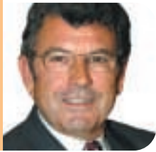
Josep Lluís Fernández Burgui Portaveu del Grup Municipal de CiU