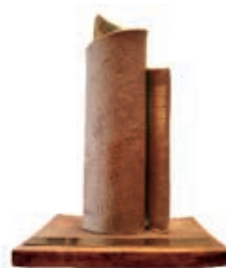
IV Edició dels Premis de Reconeixement Cultural del Baix Llobregat

Encara que en el moment de tancar aquesta edició d' El Butlletí no es coneixia la relació de guanyadors dels premis d'aquest 2005, Sant Feliu de Llobregat ha obtingut quatre finalistes en diferents apartats dels premis, candidatures que han arribat a la recta final després d'un procés de selecció en el qual han participat més d'un centenar de candidatures. Enguany, els distingits han estat el cicle de jazz ContraBaix