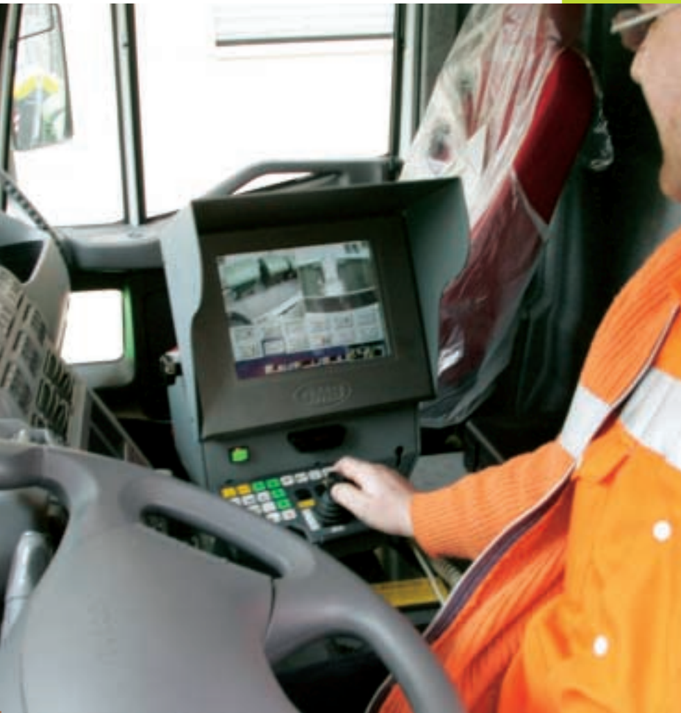
■ Interior de la cabina d'un dels nous camions de recollida.