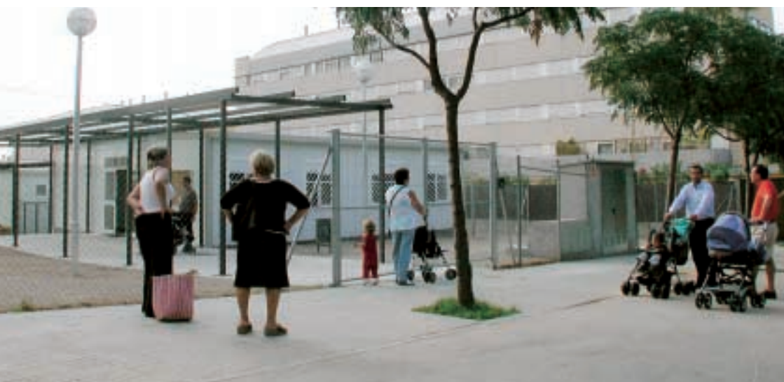
■ Nou CEIP Mas Lluí

Prosseguint amb l'educació infantil i primària, s'ha inaugurat al barri del Mas Lluí el nou centre Miquel Martí i Pol, per acollir de manera provisional una trentena de nens i nenes de P3 mentre avancen les obres de l'edifici definitiu de